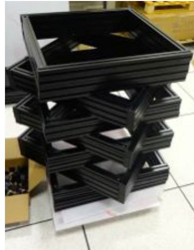
2- Assemblage des cadres de base