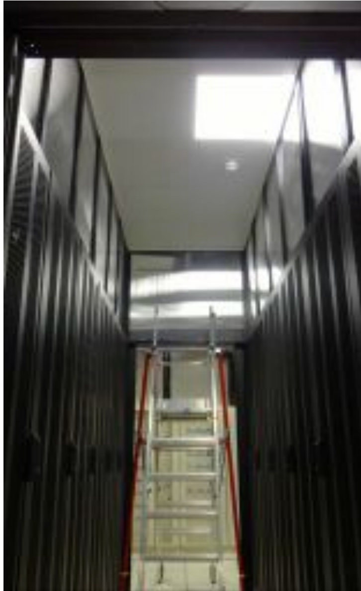
Confinement par réhausses terminé