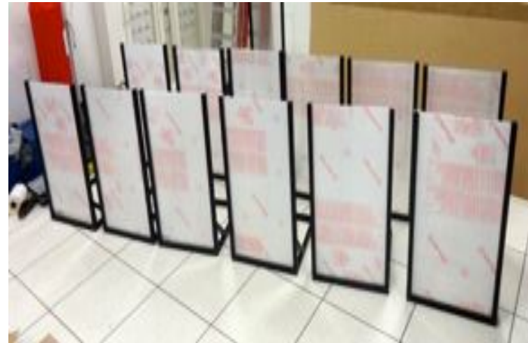
5 – Insertion des plaques – Retrait des polyanes de protection