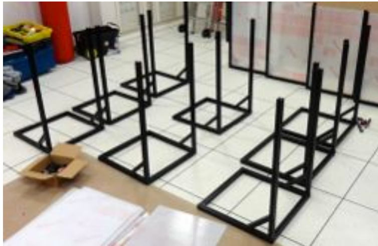
4- Réplication de taille des montants et assemblage en série