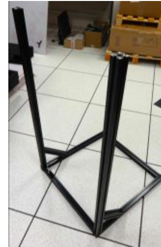
3- Assemblage des montants sur 1 er exemplaire – Recoupe éventuelle des montants